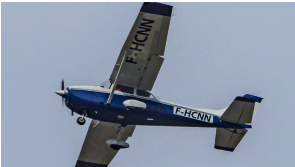
PHOTO DE L'AERONEF