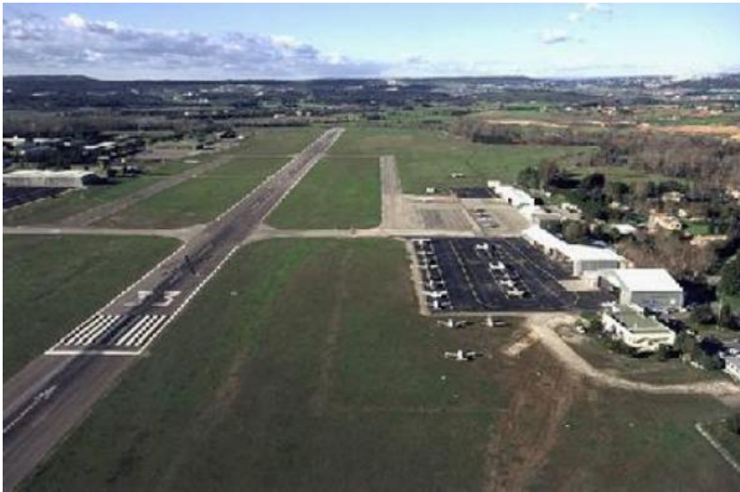
Aéroclub Marseille aviation.

L'utilisation de l'article, la reproduction, la diffusion est interdite - LMRS - (c) Copyright Journal La Marseillaise